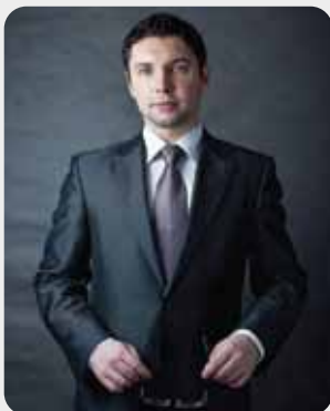
Kierownik Działu Audytu i Projektów