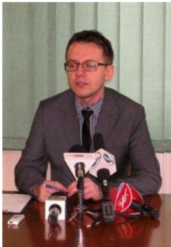
Wojciech Dąbrówka

O ochronie danych osobowych coraz częściej słycać w debacie publicznej. A wszystko za sprawą unijnej reformy, która już wkrótce zastąpi polskie regulacje, stawiając przed licznymi podmiotami wiele wyzwań natury organizacyjnej i technicznej, a także groźbę wysokich kar finansowych. Czym są dane osobowe, dlaczego należy je chronić, w jakim stopniu dotyczy to mediów i czy czeka nas kolejna nowelizacja prawa prasowego?